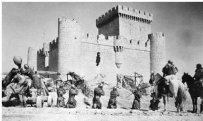
Exposición fotográfica Castilla y León: escenario de cine

Del J 4 de julio al 3 noviembre - Sala de exposiciones temporales