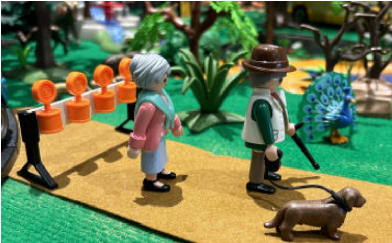
Instalación Temporal Campamentos de verano