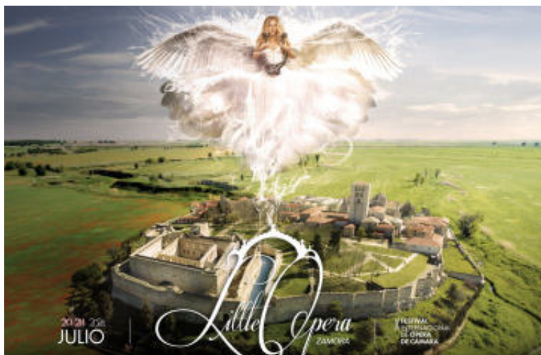
IX Festival Internacional de Ópera de Cámara

X 21, J 22 y V 23 de agosto - 11:30-13:30 h - Salón de actos